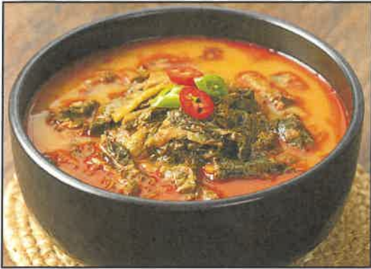
남원 추어탕 15,000원

단백질과 칼슘이 많아 보양식으로 유명하고, 진하고 구수한 국물이 깊은 풍미가 남