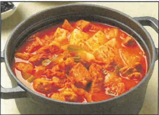
돈육 김치찌개 16,000원

단백질과 칼슘이 많아 보양식으로 유명하고, 진하고 구수한 국물이 깊은 풍미가 남